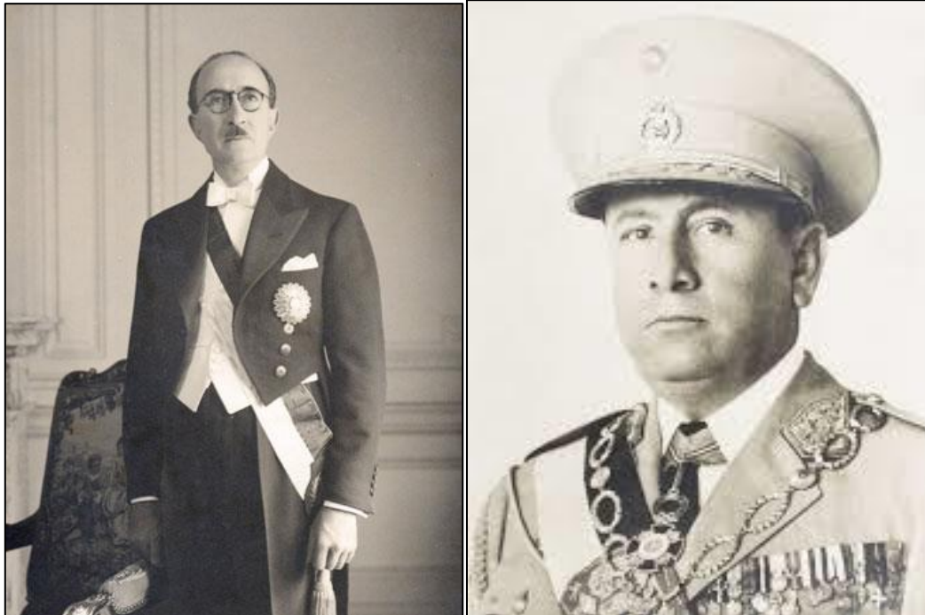
Dr. José Luis Bustamante y Rivero, Presidente constitucional del Perú entre 1945 y 1948. Fue defenestrado por una Junta Militar presidida por Manuel A. Odría.

c) la creación intelectual y artística; y, finalmente, d) la investigación científica y tecnológica. Nótese que en ningún momento se le solicitan “transformar” o siquiera “cambiar”. La palabra tácita es “mantener”, “continuar”. Por supuesto, el Estado en su afán de mostrarse como una organización que promueve los estudios superiores universitarios, propone y aplica un régimen tributario específico hacia los inversionistas privados en el rubro. Bajo lo expuesto, empezaremos ahora nuestro viraje hacia otros tiempos, otro Perú, a fines de la década de 1940.