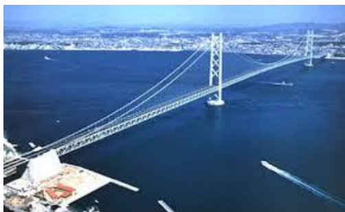
Fig. 1 Puente Akashi- Kaikyo, Japón

Las ecuaciones de la onda describen propagación de partículas. Desde un punto de vista matemático la ecuación de ondas es el opuesto exacto de la del calor pues se trata de un sistema reversible en tiempo, conservativo, carente de efectos regularizantes y en el que la velocidad de propagación es finita. Están aplicadas a la mecánica cuántica (la ecuación de Schrödinger, que representa el movimiento de las partículas microscópicas, haciendo un papel análogo a la segunda ley de Newton en la mecánica clásica), de la Física (problemas de elasticidad) y en la ingeniería (vibraciones de estructuras, construcción de puentes), entre otros, como se describe en la siguiente figura.