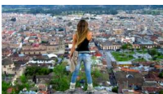
Vista de la ciudad de Cajamarca

https://viajeslm.com/paquetes/paquete-cajamarca-5dias-4noches-hotel-retamas-con-hotel-desayunos-y-mas/