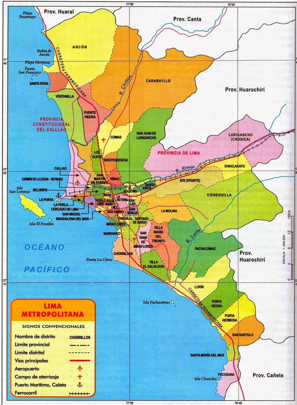
Mapa I- extraído Prensa ITV Perú. http://prensaitvperu1.blogspot.pe/

En el Mapa II podemos observar el carácter Urbano-agrícola del distrito, donde la zona urbana esta en continuo contacto con la zona agrícola, echo que permite inferir En el caso particular de Carabayllo su ocupación urbana avanza de manera desordenada por la parte agrícola y por los terrenos eriazos igualmente ubicados en ambas márgenes del rio Chillón. Lo que a la larga según el desmesurado avance de la metrópoli, convierte a la larga a este distrito en uno de los de mayor crecimiento urbano en los años por venir, en desmedro de las zonas agrícolas, y el consecuente daño ambiental que traerá esta expansión urbana de la ciudad.