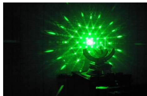
Fig. 2 Estructura de cristales ópticos vía difracción óptica.

El término disipativo local a(x)u_t en el sistema planteado hace que la solución del sistema tenga un comportamiento asintótico, es decir, decae exponencialmente cuando t tiende al infinito y como consecuencia tenga sentido el Problema planteado. Los términos semilineal f(u) y \alpha u determinan algunas irregularidades más que afectan a la propagación de ondas.