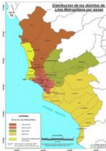
Mapa de zonificación de Lima Metropolitana. Lima-Perú

http://eudora.vivienda.gob.pe/OBSERVATORIO/zonificacion.php