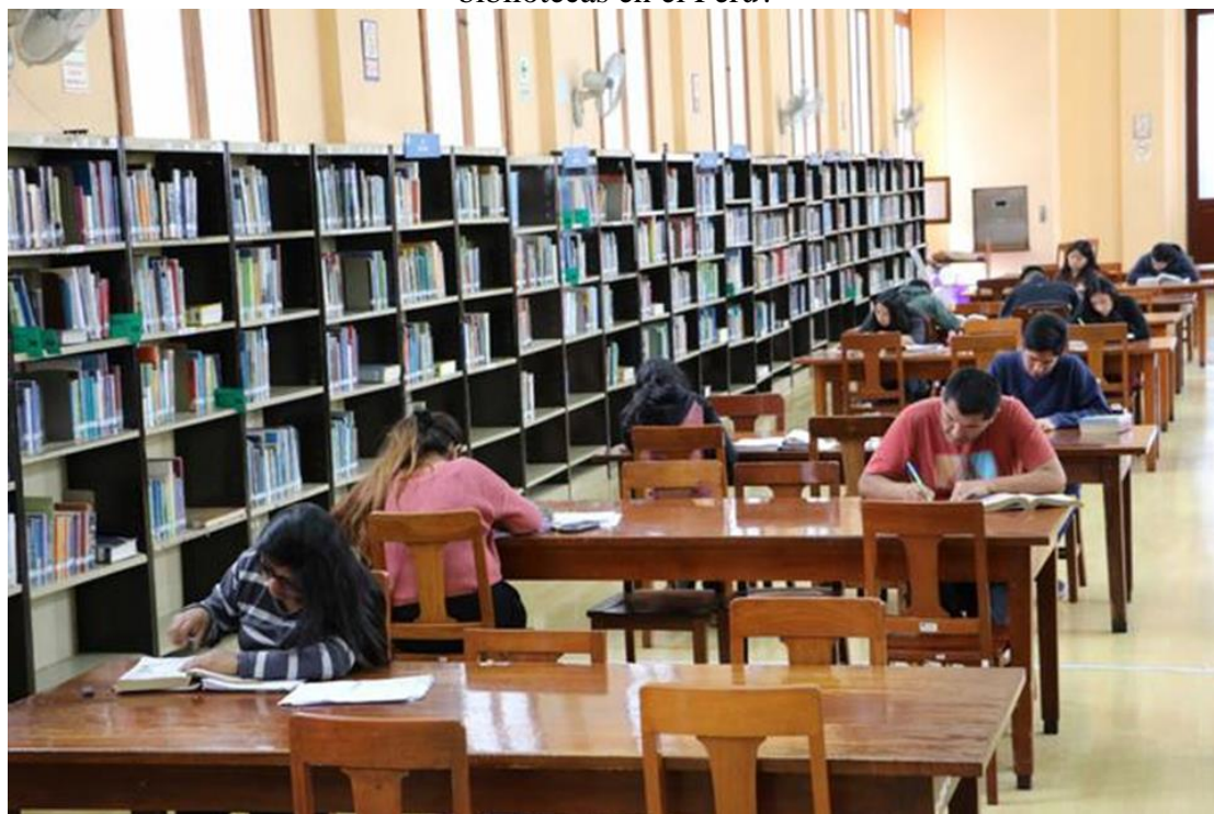
Foto N°4: Nos preguntamos ¿Cuál es el porcentaje de personas que accede a las bibliotecas en el Perú?