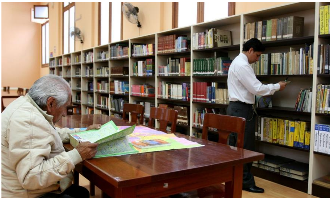
Foto N°1: La biblioteca pública presta sus servicios sobre la base de igualdad de acceso de todas las personas, independientemente de su edad, raza, sexo, religión, nacionalidad, idioma o condición social.