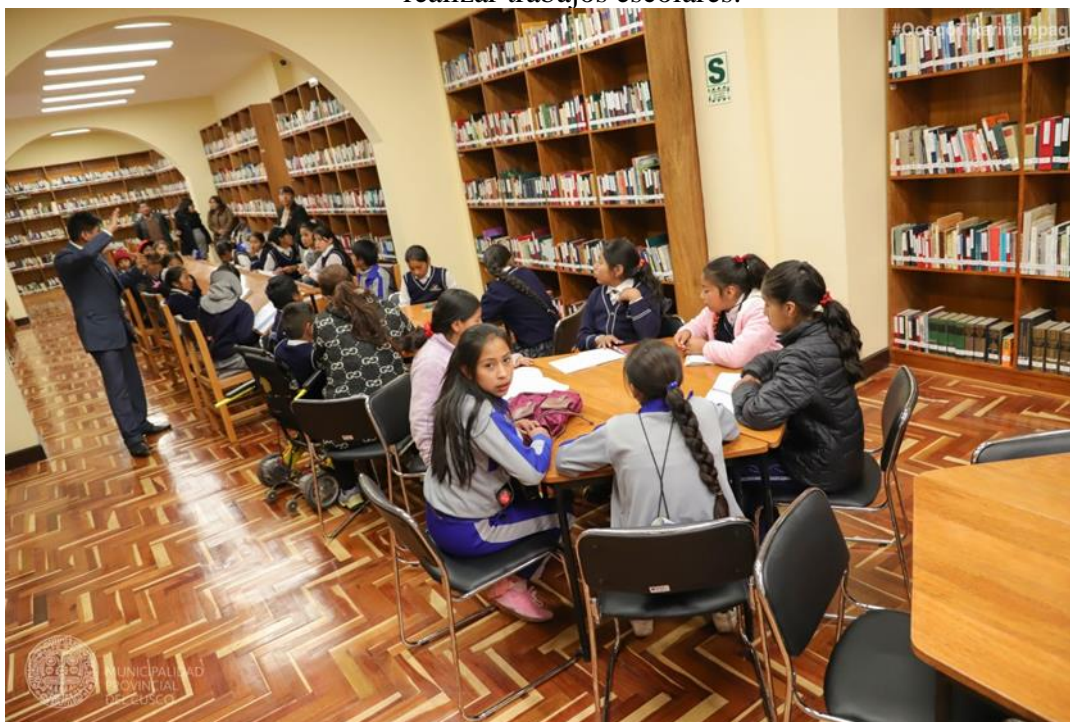
Foto N°2: Los estudiantes se reúnen en las bibliotecas con sus grupos de estudio para realizar trabajos escolares.