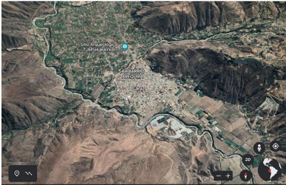
Figura N°1: Mapa satelital Caraz