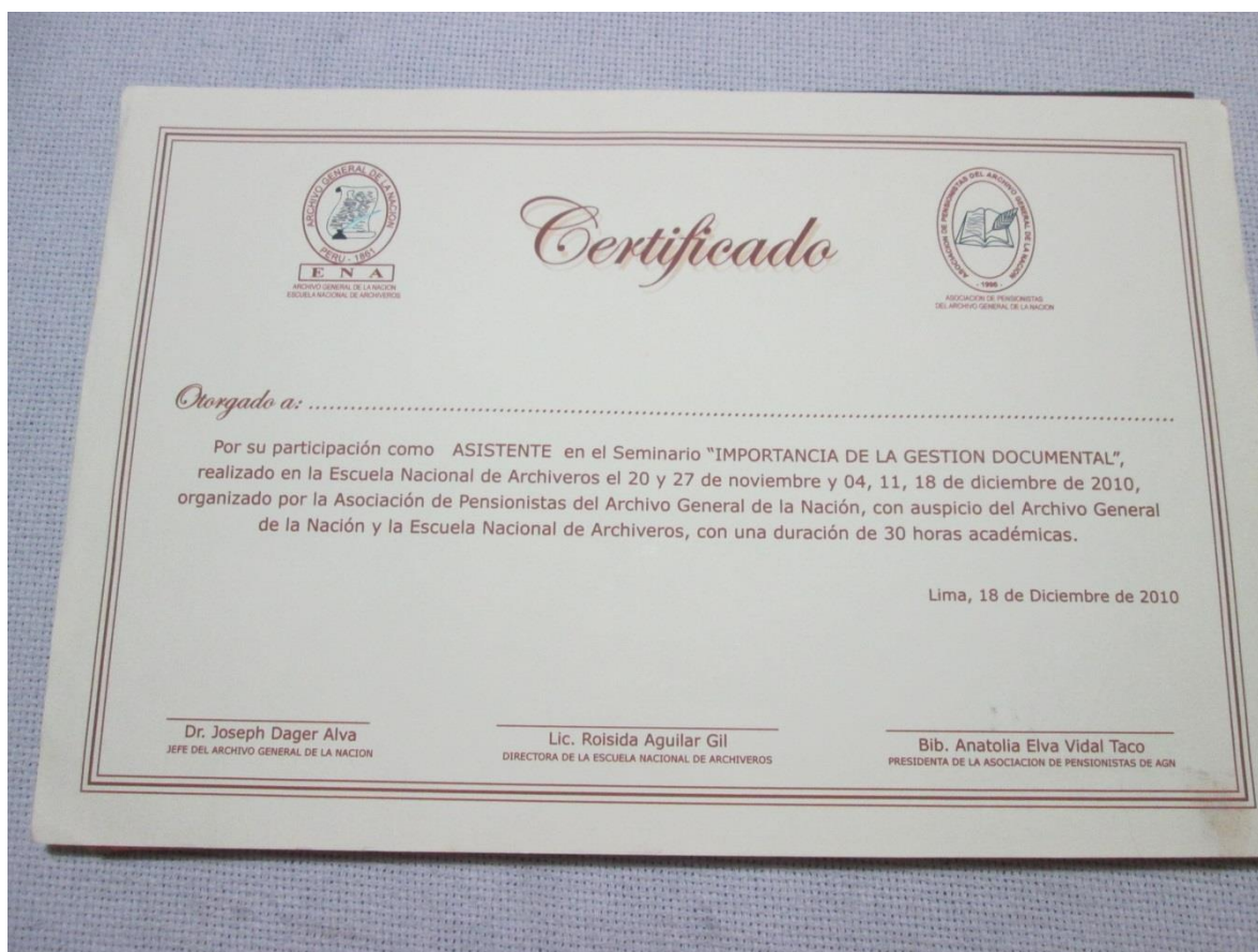
Foto N°1: Curso Seminario importancia de la gestión documental 2010