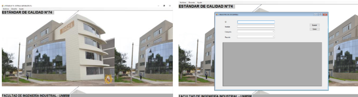
Figura 2. Aplicación de escritorio en Visual Studio C# (Elaboración propia)

Finalmente, se desarrolló la aplicación de escritorio en Visual Studio 2015 en el lenguaje de programación C#. Se programó mediante el patrón de software MVC (Modelo-Vista-Controlador). Esto permitió programar con mayor facilidad.