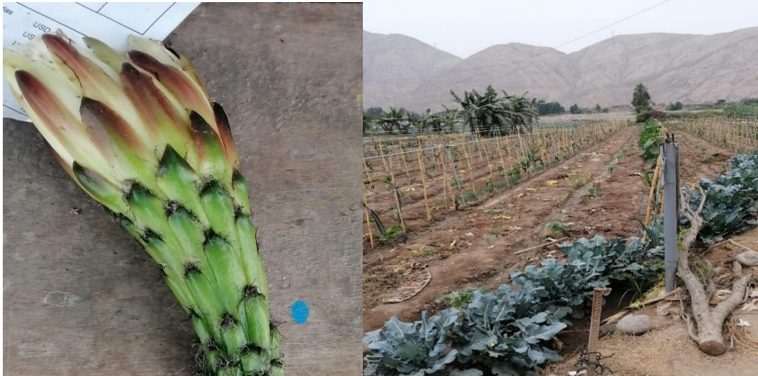
Foto N° 1: Trabajo de campo, Plantinera en Huanchipuquio-Santa Rosa de Quives

15 de febrero de 2021. Trabajo en la plantinera del Sr. Aníbal Espinoza. Policultivos.