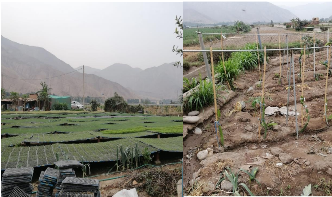
Foto N° 2: Trabajo de campo, Plantinera en Huanchipuquio-Santa Rosa de Quives

Fuente: Grupo de investigación CTS-Lima Norte. 15 de febrero de 2021. Plantinera en Huanchipuquio-Santa Rosa de Quives.