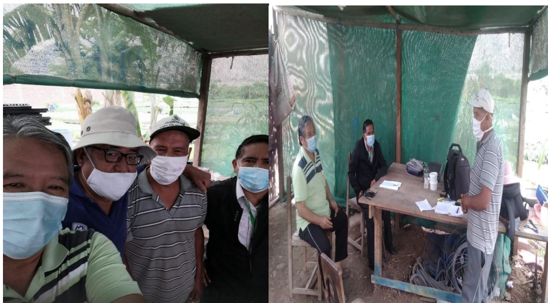
Foto N° 3: Trabajo de campo, Plantinera en Huanchipuquio-Santa Rosa de Quives