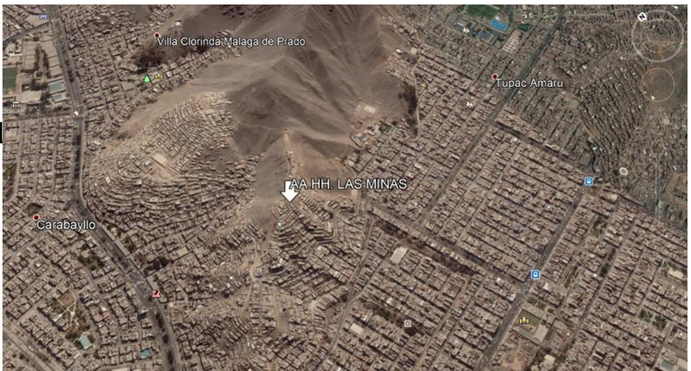
Foto N° 1: ubicación geográfica del asentamiento humano “Las Minas”

En esta oportunidad se brindó apoyo a 200 personas del asentamiento humano “Las Minas”, ubicado en la provincia de Lima, en el distrito de Comas, en la zona 2 del mismo distrito, este asentamiento humano está construido con material precario y hasta la fecha no cuenta con servicios básicos. Los pobladores obtienen agua gracias a un convenio entre la Municipalidad Distrital de Comas y Sedapal, el AA:HH. no cuenta con servicio de desagüe.