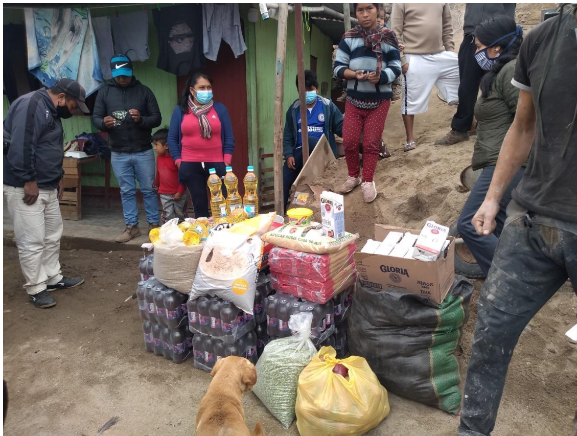
Foto N°4: Se entregaron víveres de primera necesidad además de bebidas refrescantes