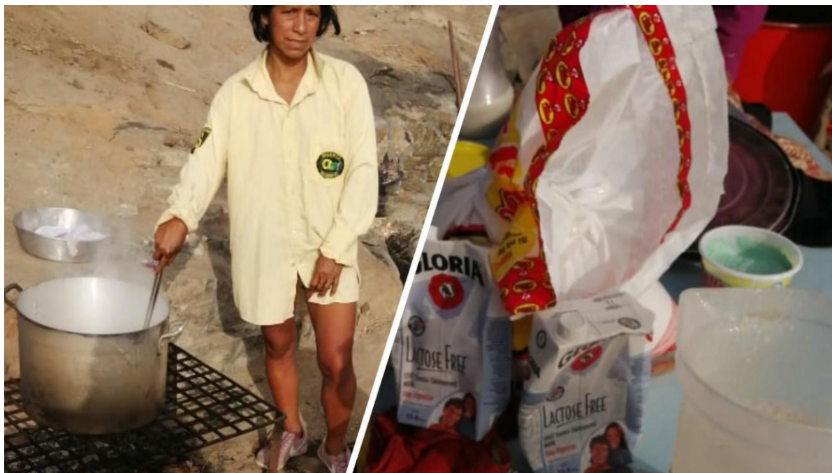
Foto N°7: Al día siguiente se utilizaron los víveres para preparar la olla común de los vecinos del asentamiento humano “29 de enero”