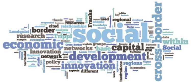
Wordle de Análisis de Literatura creado por el autor.